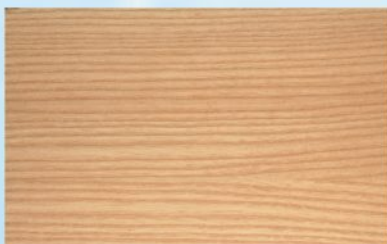
■ jasan hnědý